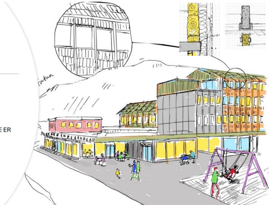
Figur 1 Forslag fra arkitekt