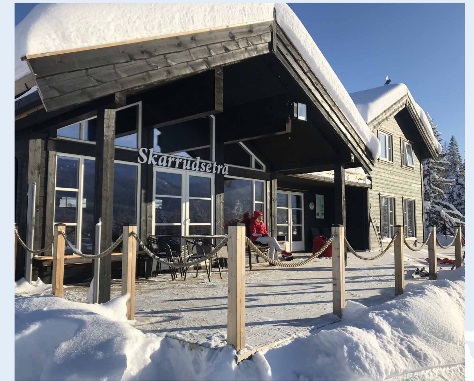
Skarrudsetra fjellstue åpnet dørene vinteren 2018. Skarrudsetra har både servering og egen hyttebutikk. Det avholdes en rekke ulike arrangementer på og ved fjellstua.