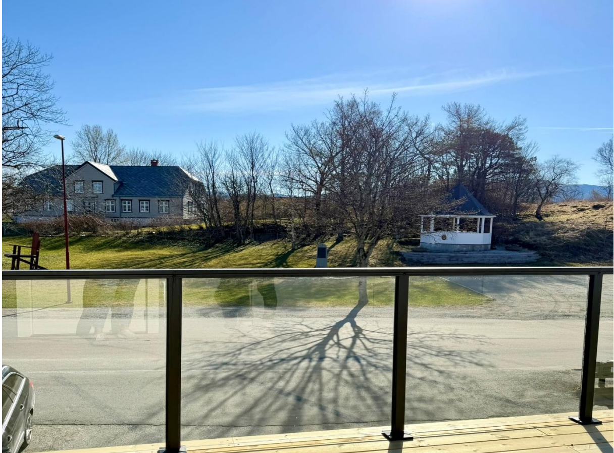
Utsikt mot øst