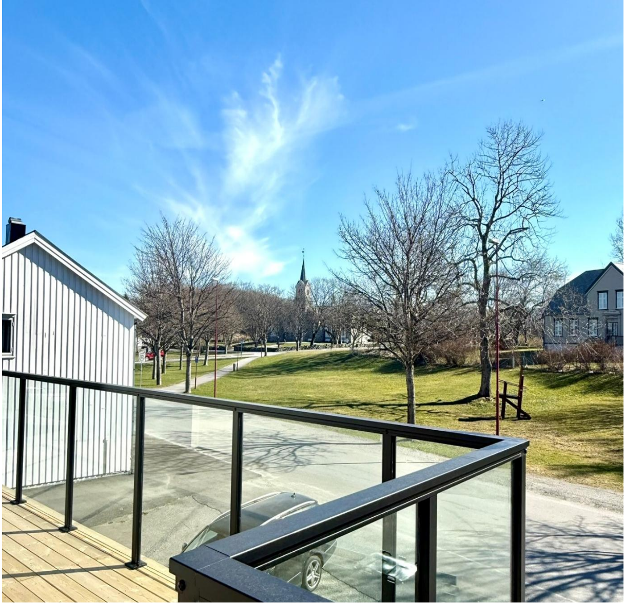
Utsikt mot kirka