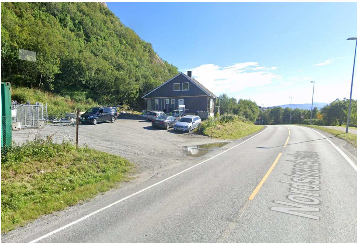
Hus mens renovering pågikk