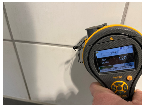
Nede ved gulv i dusj.