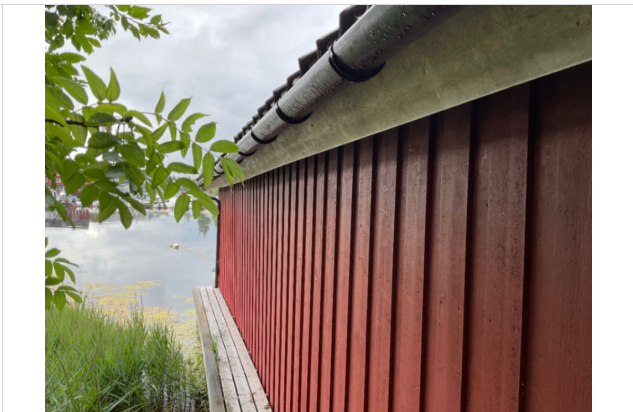
Fremstår som bra. Her er takrenne på begge sider. Gangvei for vedlikehold.

Bygget er oppført i bindingsverk, med stående malt kledning. Takkonstruksjonen er plass bygget Denne konstruksjon er fornyet i senere år. Kledning fremstår som bra. Bindingsverk er utført i impregnert virke. Her er støpt ny betongmurkant oppå den gamle steinmuren som går på 3 sider av bygget. Stein muren er av eldre årgang og er lite synlig for befaring/vurdering. Og ikke vurdert. Her er laget gangvei i impregnert bord, ( av nyere dato) i impregnert på 3 sider av bygget. Her er vannspeil i mellom og åpent for en sjekte. Som kan heises opp i fra vannflaten. Vannspeil/Åpning er 2,45 x 7,35m Port ( trenger noe reparasjon). Taktegl av eldre årgang. Takstmann har ikke vært oppå taket og kontrollert dette. Selv om dette ser bra ut. Kan her være feil/skade.