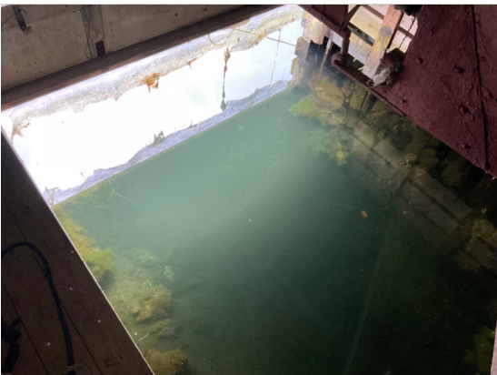
Vannspeil i mellom side vanger.