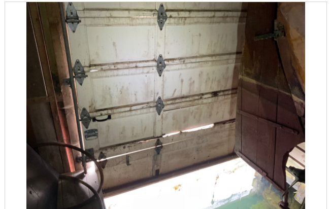
Leddporten er noe sliten og trenger vedlikehold.