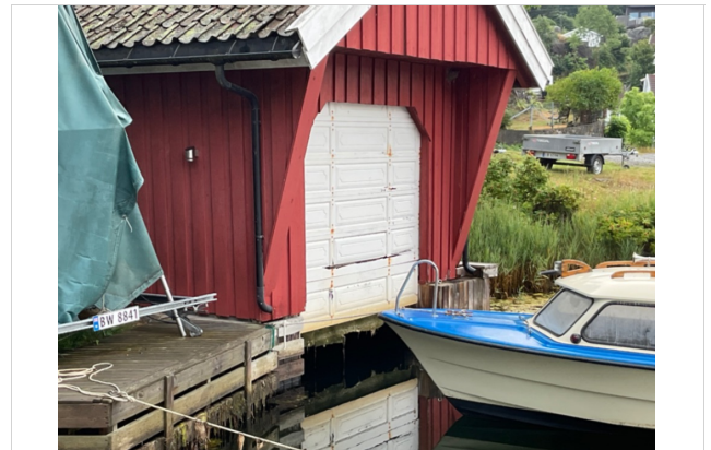
Port ( trenger noe reparasjon) og bryggekant på siden.