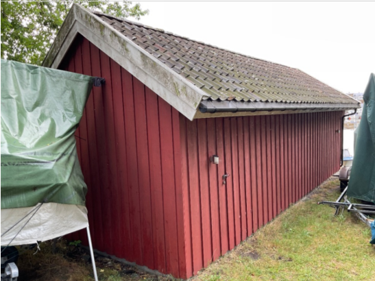
Bilde i fra vei ned og labankdør inn til båtnaust. Her er god lagringsplass på siden av bygget. Se kart.