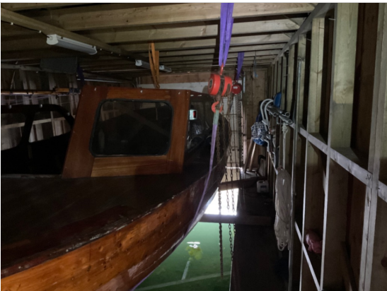
En tre snekke får grei plass her og kan heises opp