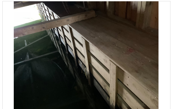
Ny gangvei på begge sider.