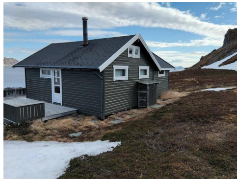
Fasade vest og sør