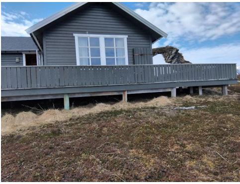
Fasade nord og vest