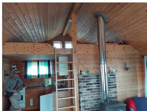
Hems, ca 10 m2