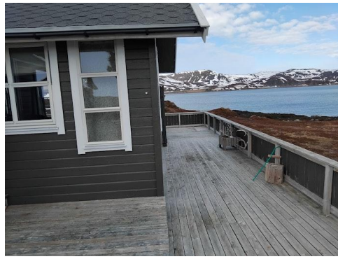
Stor terrasse, noe malingslitt.