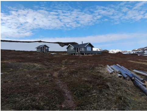
Hytta og uthuset.