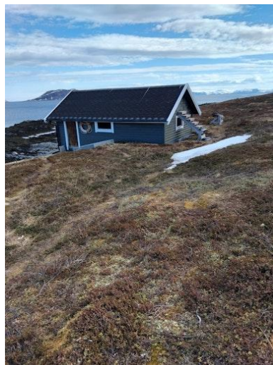
Naust med trapp til hems.