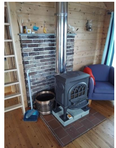
Vedovn i stua.