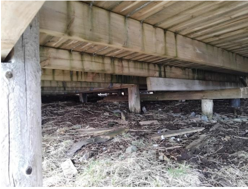
Funamentert på peler.