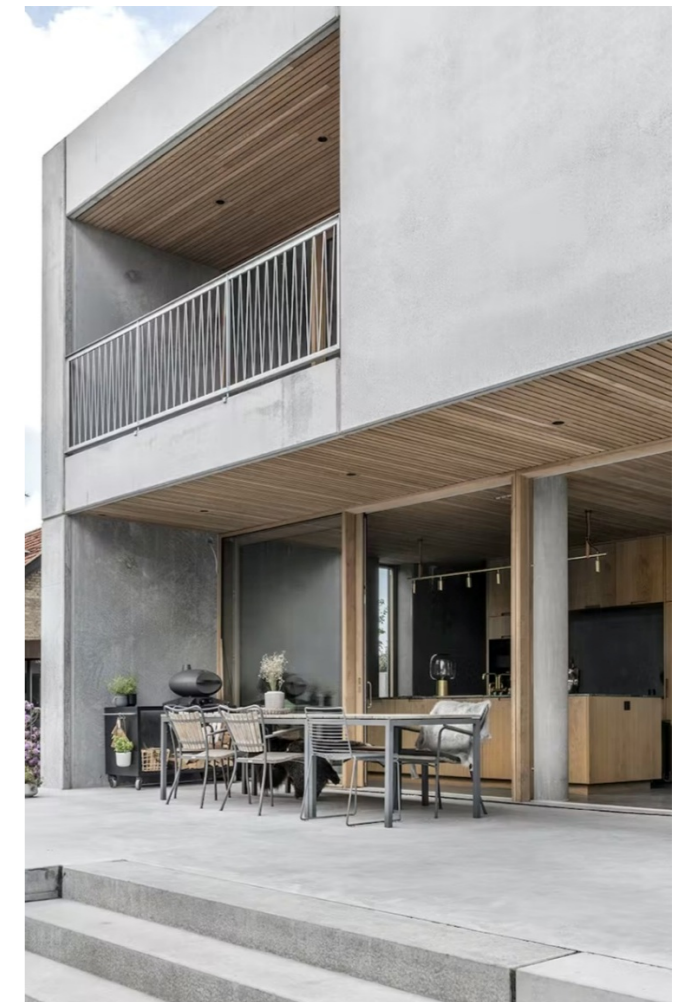
Fasader i betong med innslag av ubehandlet trekledning