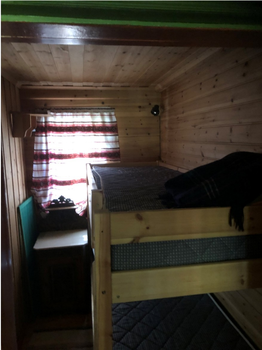
Figur 1 Soverrom 1