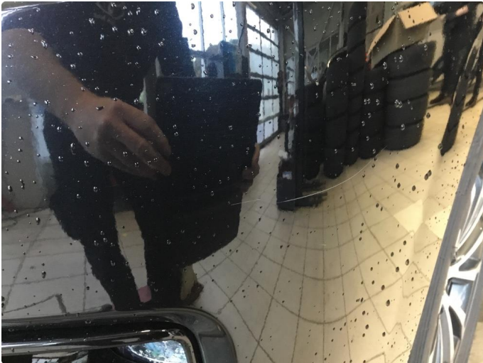
1.1 Ripe fangerhjørne - poleres bort