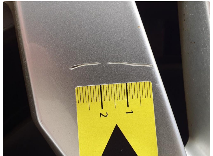
1.1 Ripe i vinterfelg