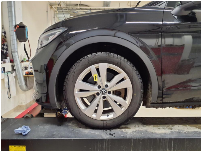
1.1 Ripe i vinterfelg