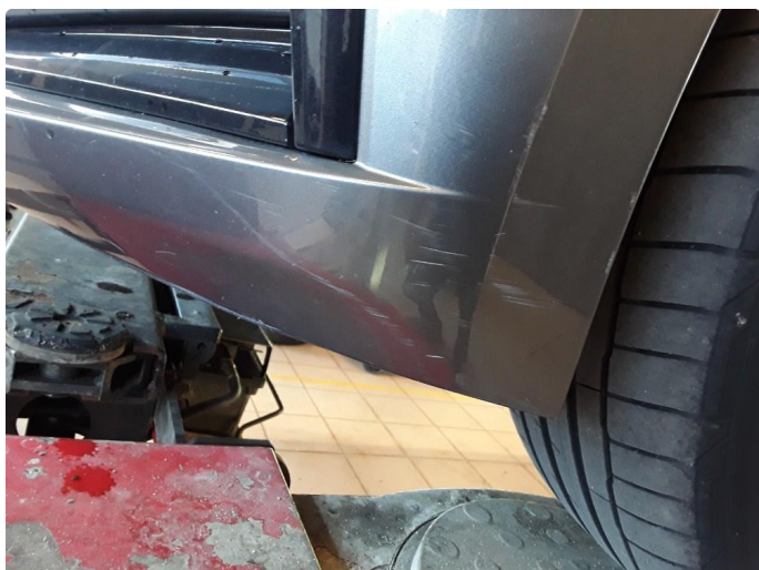
1.7 Noe riper.