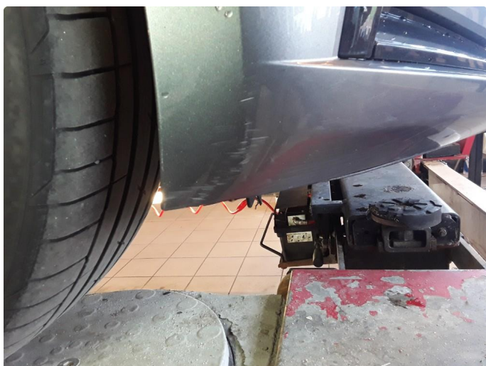
1.7 Noe riper.