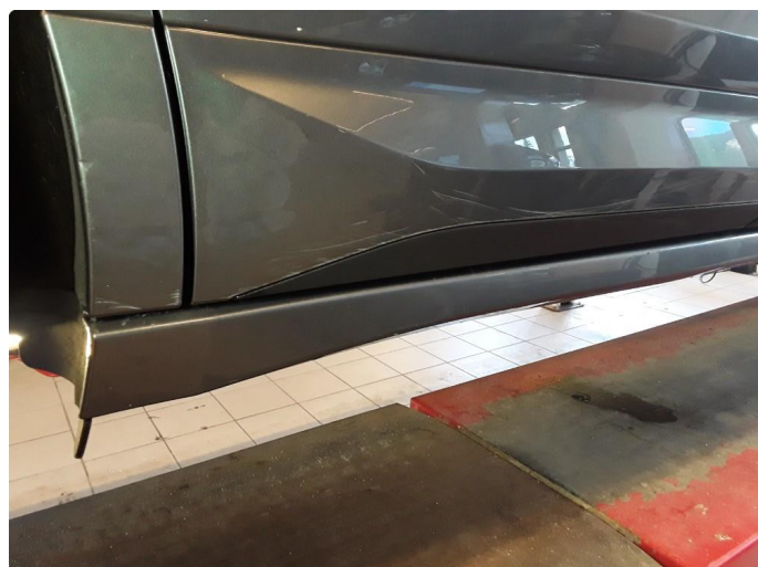
1.2 Noe riper på lister.