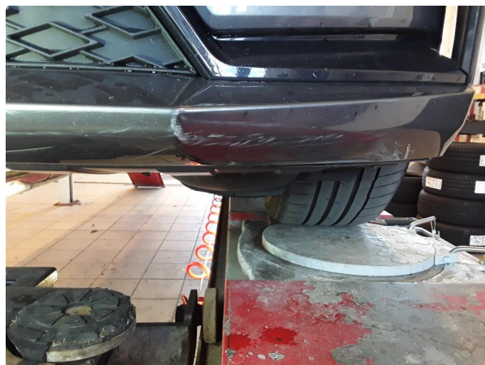
1.7 Noe riper.