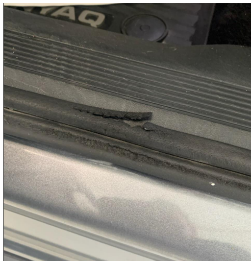
1.6 Noe skadet list venstre døråpning foran. Blir byttet.