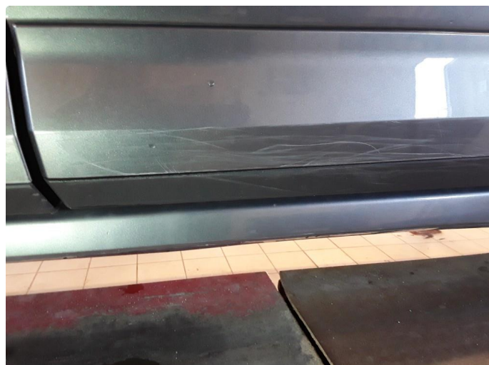
1.2 Noe riper på lister.