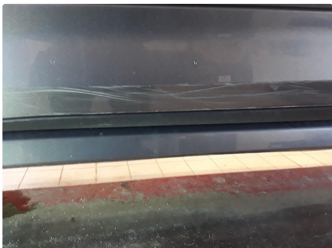
1.2 Noe riper på lister.