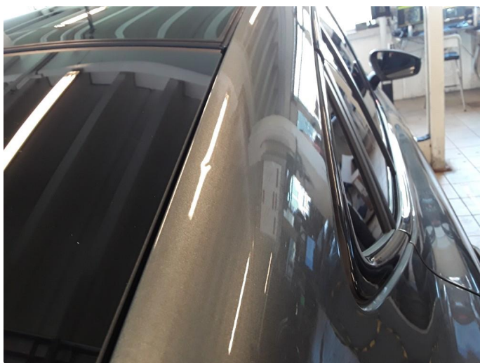
1.5 Liten bulk. Blir forsøkt med bulkfix.