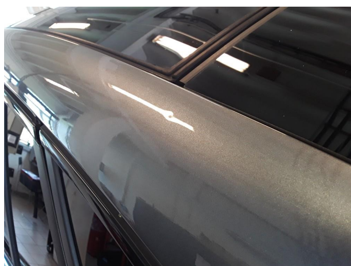
1.4 Liten bulk. Blir forsøkt med bulkfix.