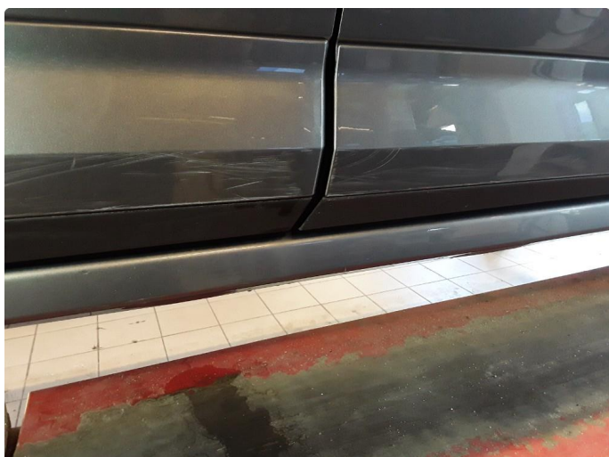
1.2 Noe riper på lister.