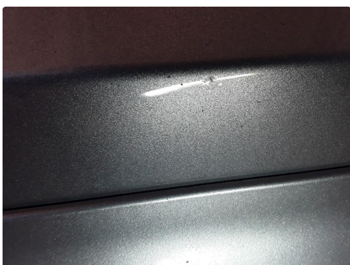
1.3 Liten steinsprut med korrosjon.