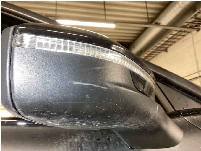
1.1 Små riper