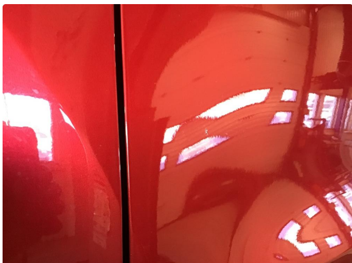
1.1 Steinsprut med rust