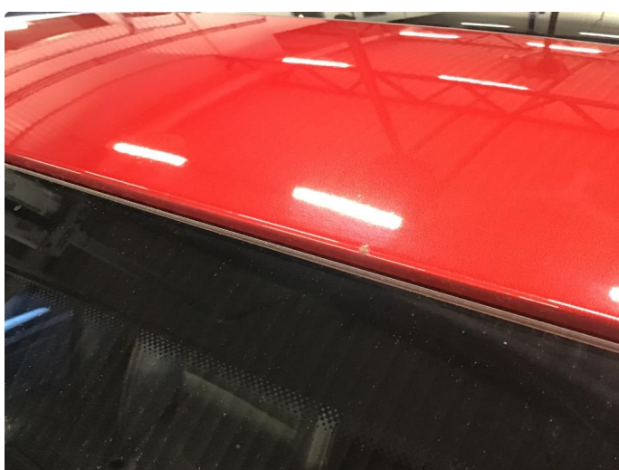
1.3 Steinsprut med rust