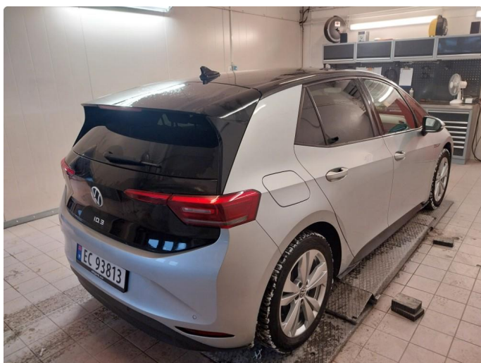
2.1 Div steinsprut og lakkriper finnes.