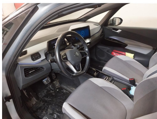
2.1 Div steinsprut og lakkriper finnes.