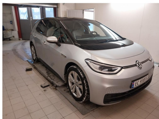
2.1 Div steinsprut og lakkriper finnes.