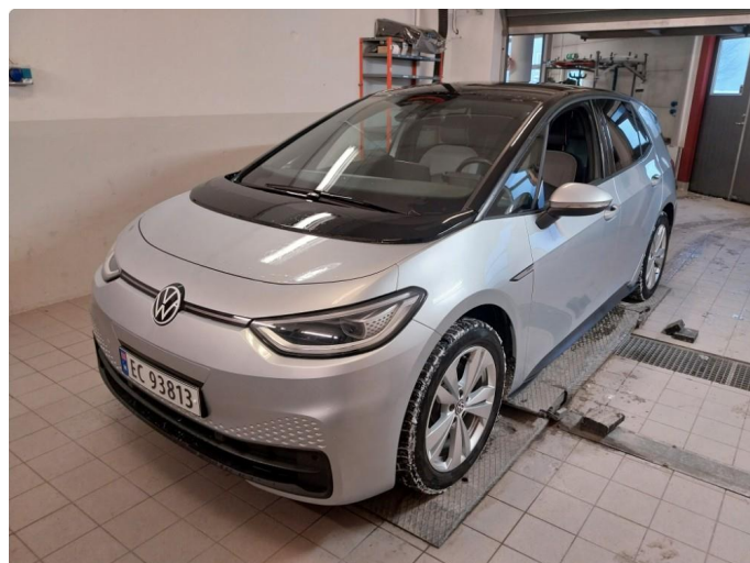
2.1 Div steinsprut og lakkriper finnes.