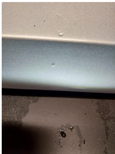
1.1 Steinsprut med rust