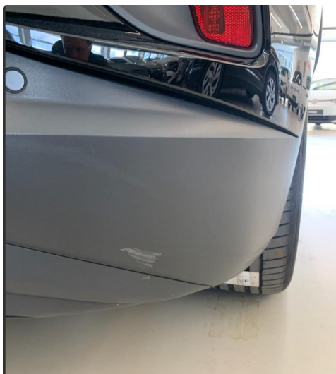
1.2 Liten ripe høyre side nedre del bak.