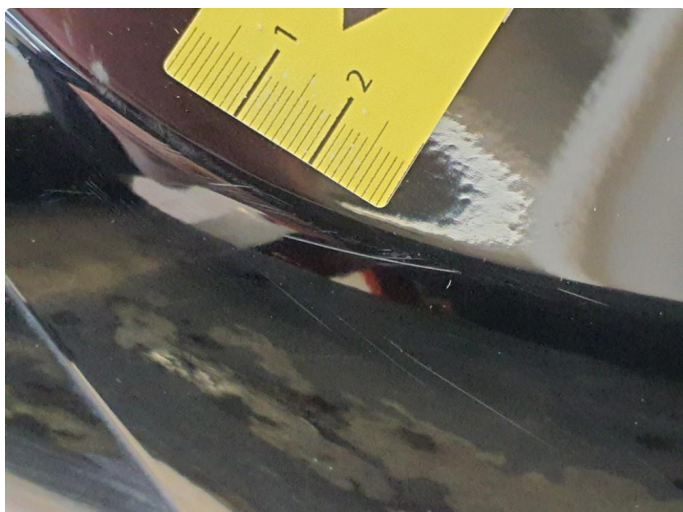
1.1 Bruksmerker støtfanger