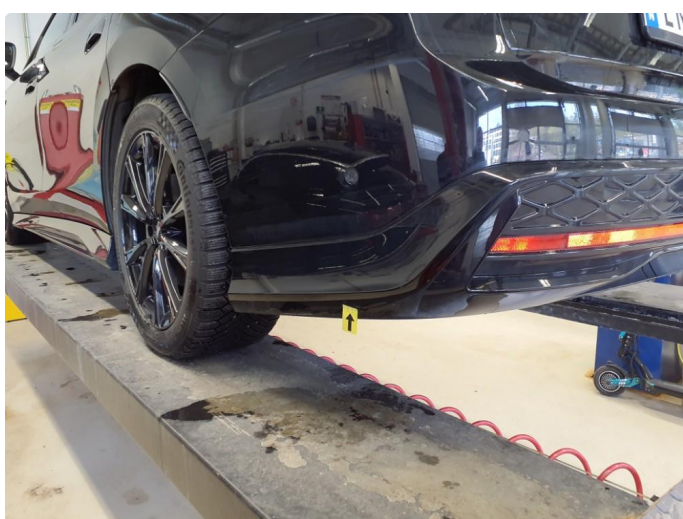
1.1 Bruksmerker støtfanger