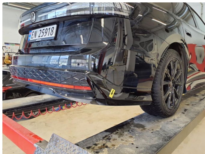
1.1 Bruksmerker støtfanger