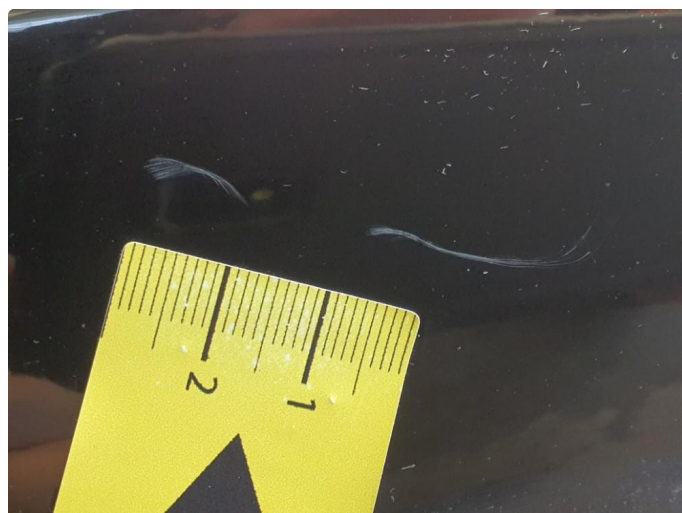
1.1 Bruksmerker støtfanger