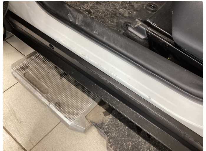
1.2 Slitt innsteg