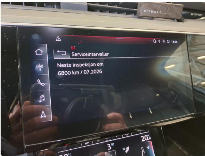
2.2 Øvrige feil