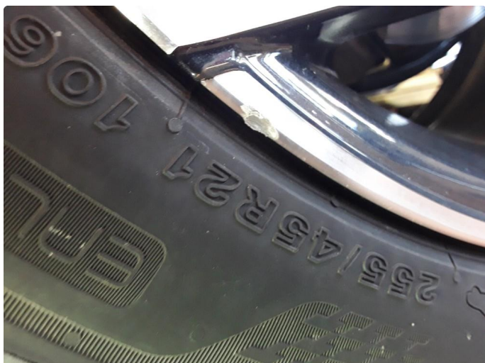
1.2 Noe kantkjørt sommerfelg.