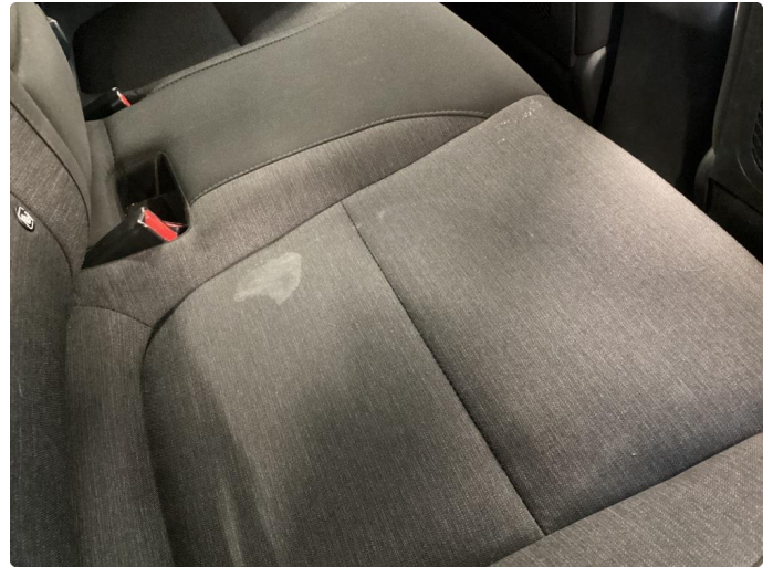
2.1 Innvendig vask