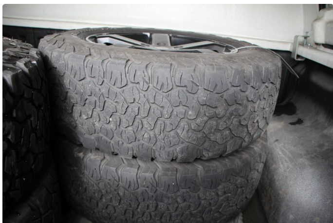
1.6 Leveres med 4 nye sommerdekk