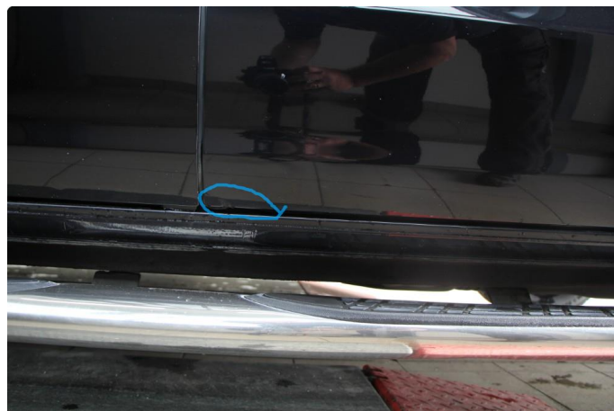
1.2 Steinsprut med rust