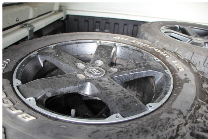
1.6 Leveres med 4 nye sommerdekk