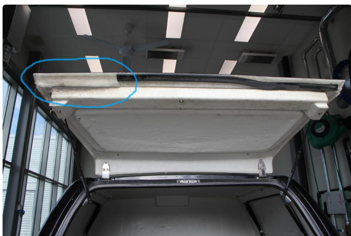
1.4 Fikk ikke til å åpne venstre luke på skap, det mangler deler av pakning på luke på skap.