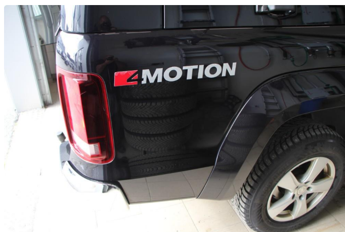
1.3 4 Motion emblem har noe flassing. Mindre på venstre side.