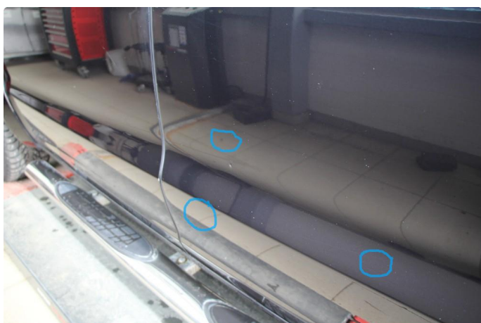
1.2 Steinsprut med rust