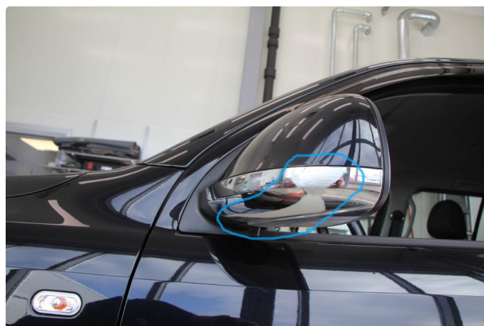
1.5 Chrome har flasset av.