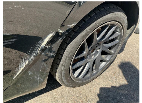
R 18. Venstre bakskjerm