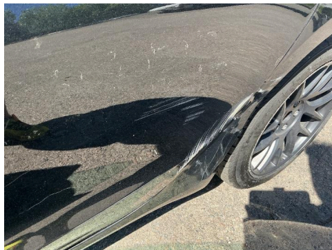
R 17. Venstre bakdør