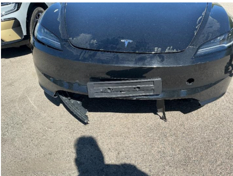
16. Støtfanger foran