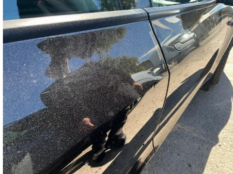
R 14. Høyre bakdør