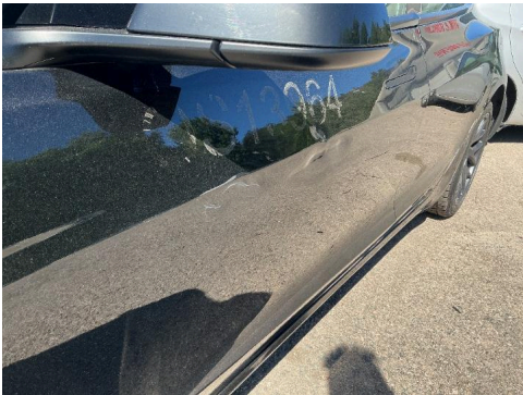
19. Venstre fordør