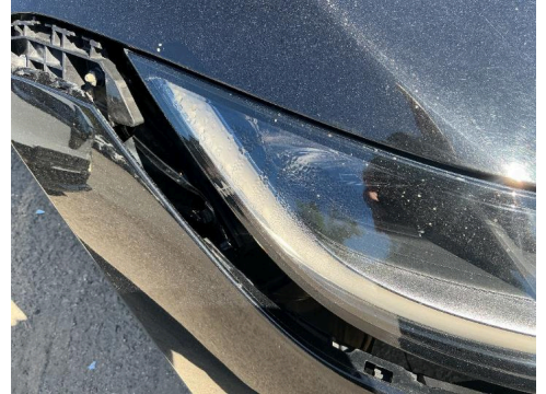
R 15. Lys