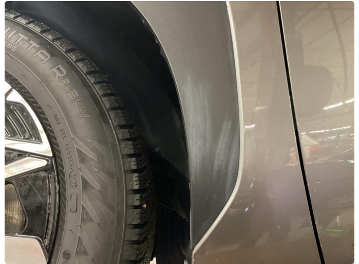
1.2 Misfarging på deksel rundt hjulbue