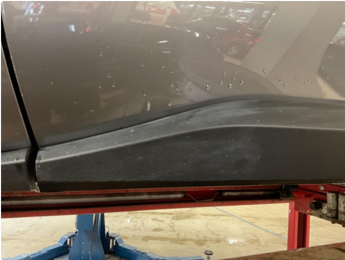
1.1 Misfarging på deksel på venstre dør