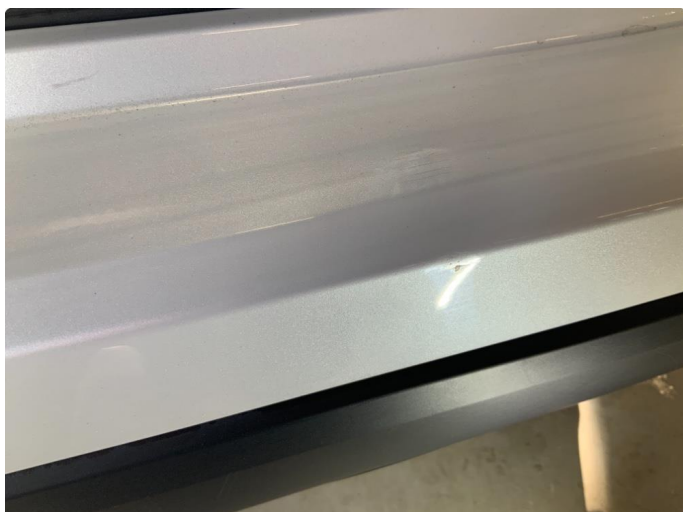
1.1 Øvrige feil. MINDRE KOSMETISK ANMERKNING.