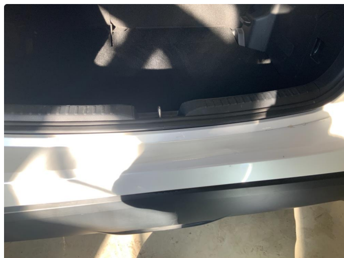
1.1 Øvrige feil. MINDRE KOSMETISK ANMERKNING.