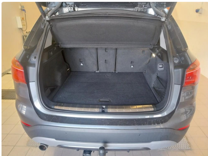
3.1 Div steinsprut og lakkriper er og finne på bilen.