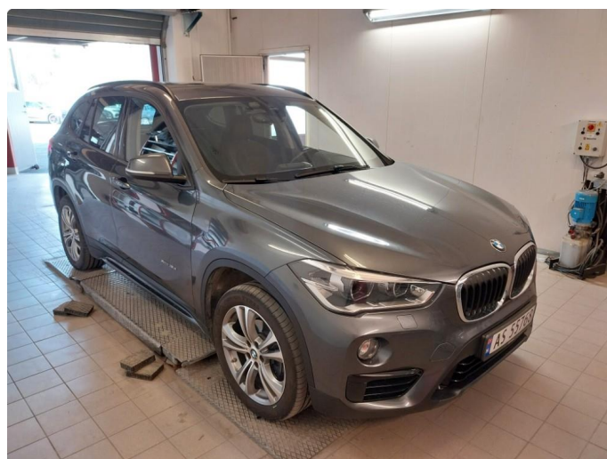
3.1 Div steinsprut og lakkriper er og finne på bilen.