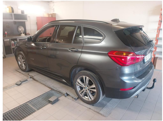
3.1 Div steinsprut og lakkriper er og finne på bilen.