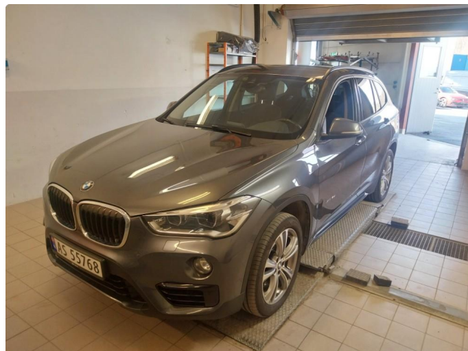
3.1 Div steinsprut og lakkriper er og finne på bilen.