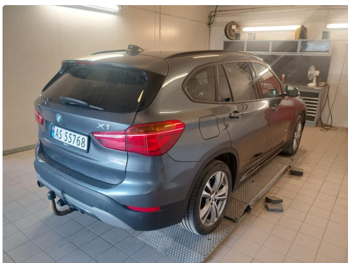
3.1 Div steinsprut og lakkriper er og finne på bilen.