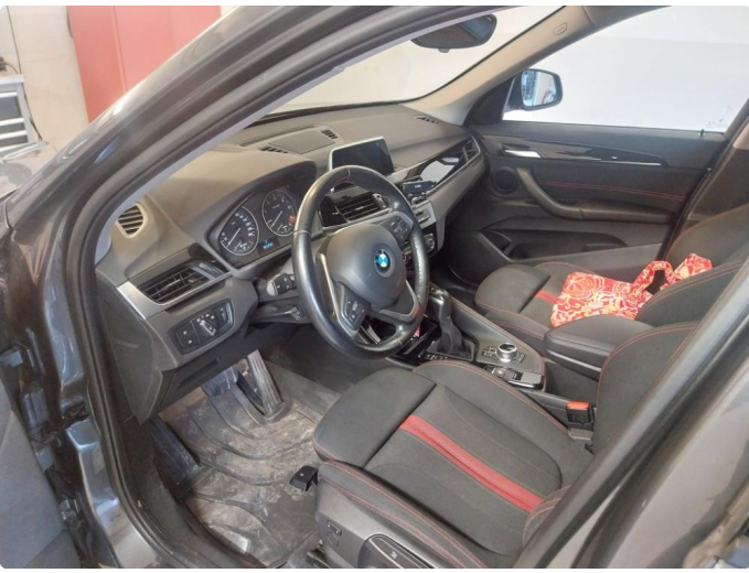
3.1 Div steinsprut og lakkriper er og finne på bilen.