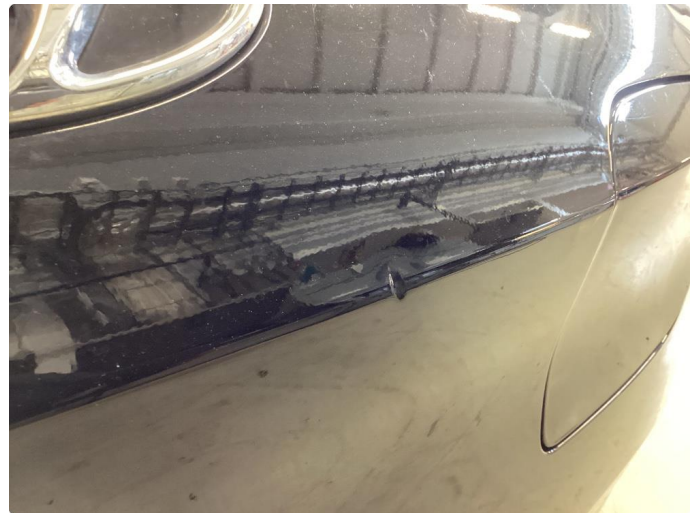
1.1 Liten merke