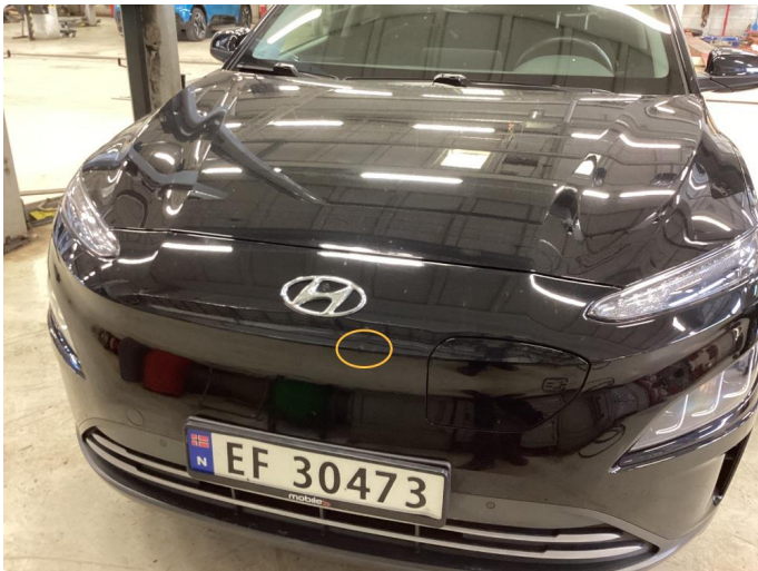
1.1 Liten merke