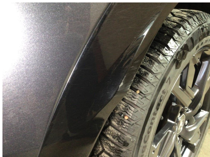
1.1 Noen små bruksmerker på begge bakskjermer og høyre side av frontfanger