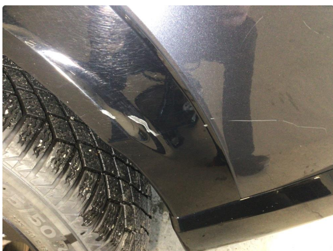
1.1 Noen små bruksmerker på begge bakskjermer og høyre side av frontfanger