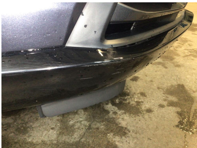
1.1 Noen små bruksmerker på begge bakskjermer og høyre side av frontfanger