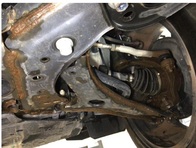
2.1 Noe overflaterust i forstilling og travers, ingen tiltak kreves