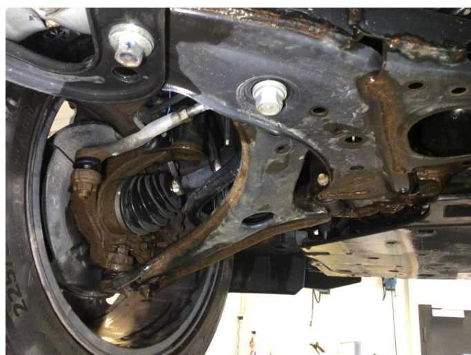
2.1 Noe overflaterust i forstilling og travers, ingen tiltak kreves