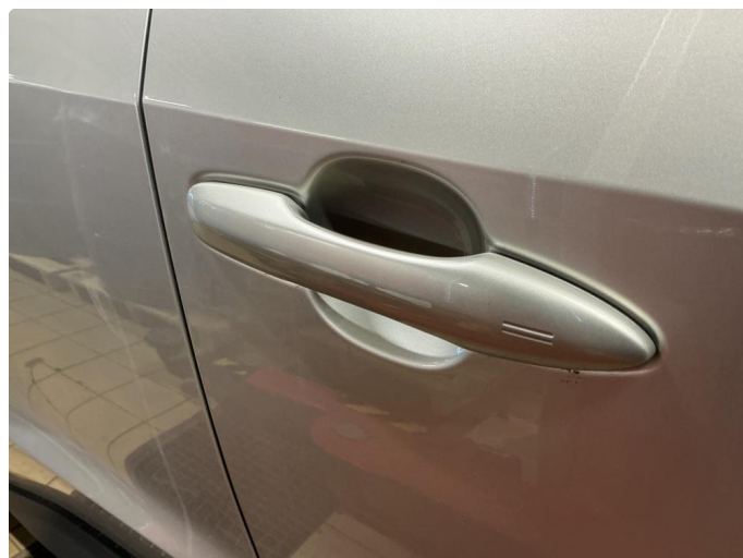
1.2 Ripe ned til grunning