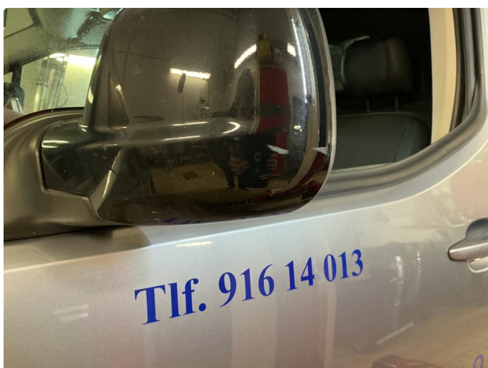
1.2 Speilhus riper