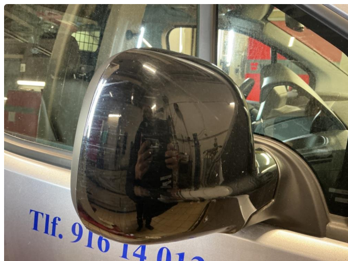
1.2 Speilhus riper