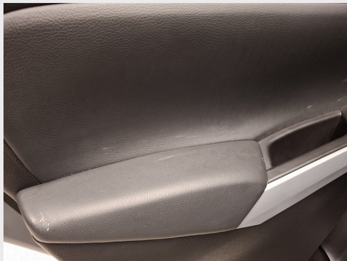
4.4 Noe hvite merker på dørtrekk v.s.f + v.s.b