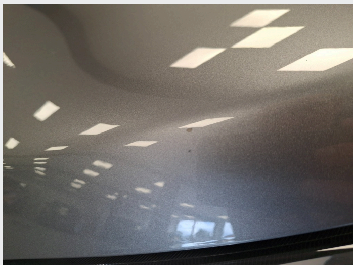
2.3 Noe steinsprut