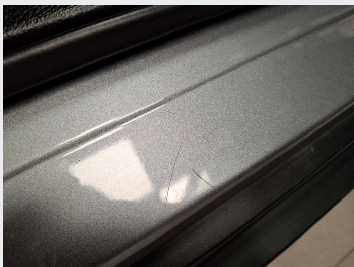
2.5 Noe riper ved døråpning v.s.f + h.s.f