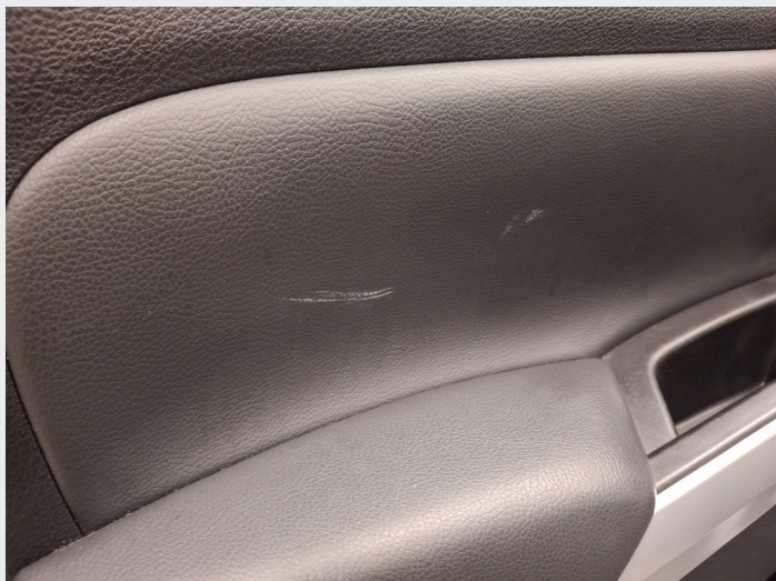
4.4 Noe hvite merker på dørtrekk v.s.f + v.s.b