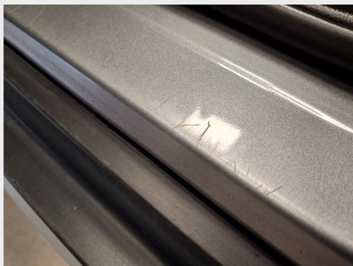
2.5 Noe riper ved døråpning v.s.f + h.s.f