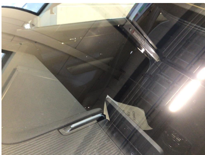
1.2 Noe steinsprut på frontvindu