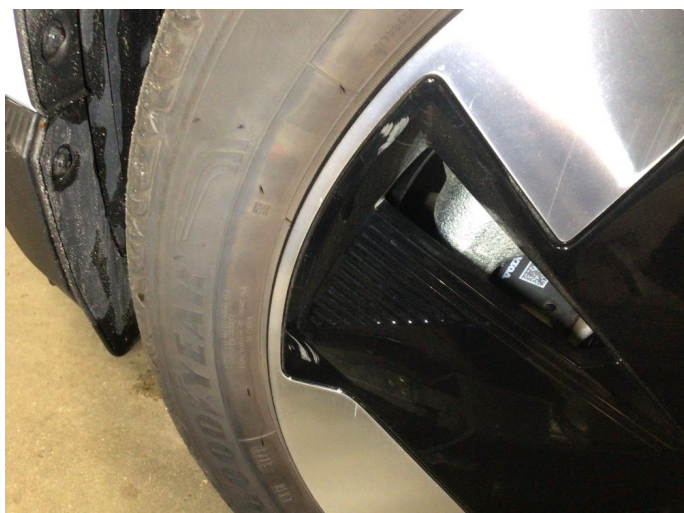
1.1 Kantkjørt tre sommerfelger og en vinterfelg