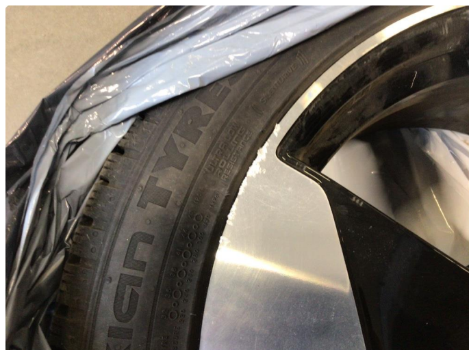
1.1 Kantkjørt tre sommerfelger og en vinterfelg