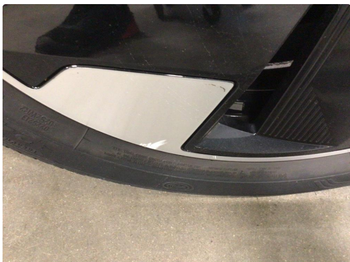
1.1 Kantkjørt tre sommerfelger og en vinterfelg