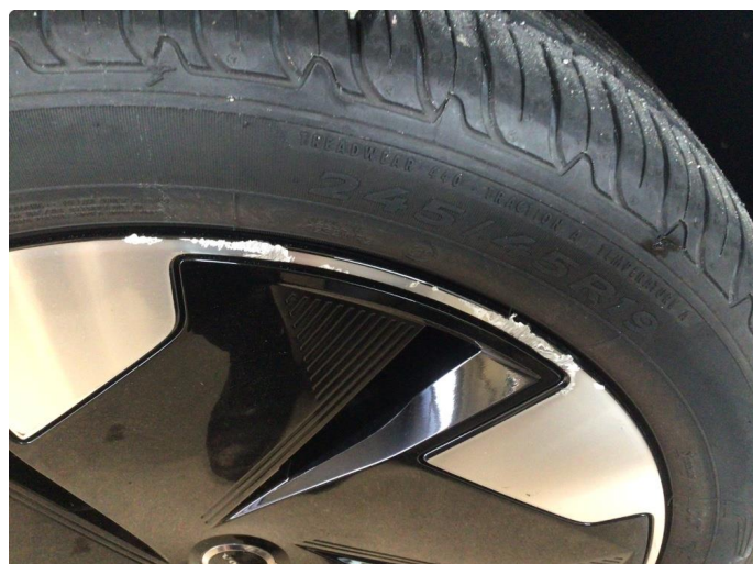
1.1 Kantkjørt tre sommerfelger og en vinterfelg