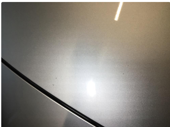
1.1 Litt steinsprut på panser