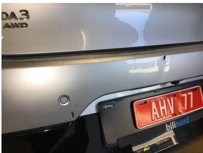
1.3 Noen hakk på bakfanger, dette blir utbedret med smart repair