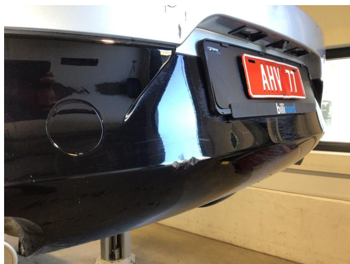
1.3 Noen hakk på bakfanger, dette blir utbedret med smart repair