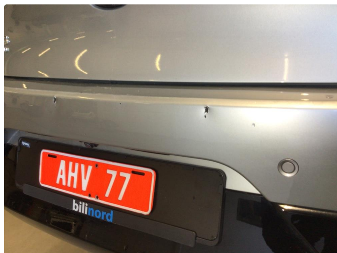
1.3 Noen hakk på bakfanger, dette blir utbedret med smart repair