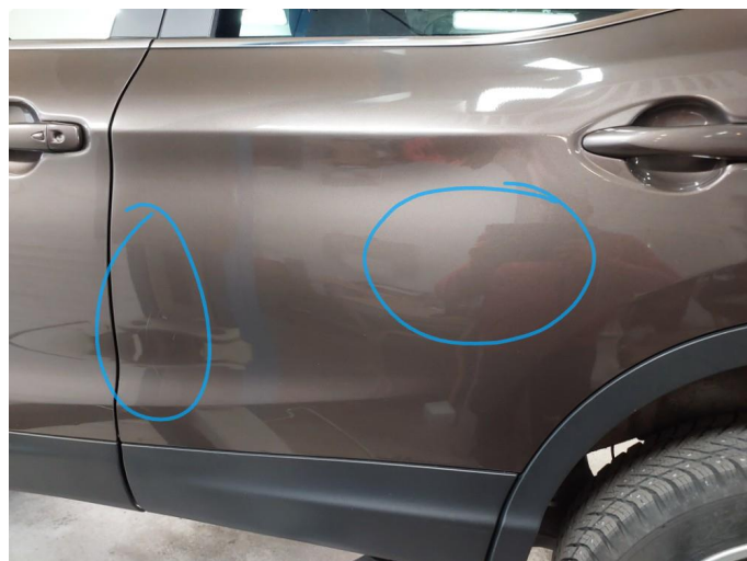
1.2 Ripe ned til grunning