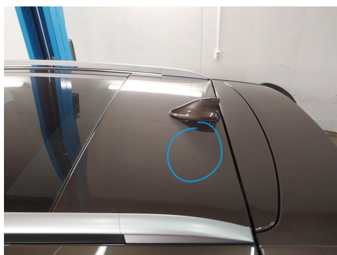
1.5 Steinsprut med rust