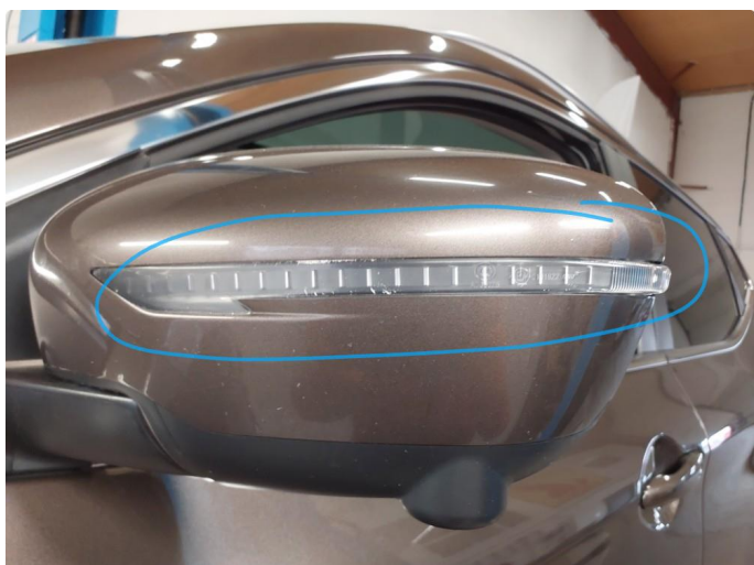
1.3 Blinklys krakelert