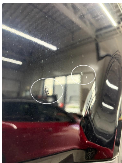
1.4 Noe lakkskader