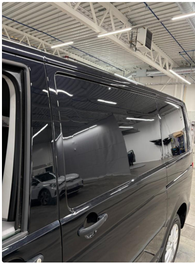
2.2 En del småbulker