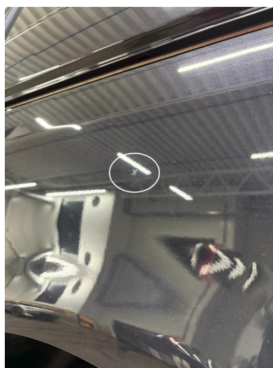
1.4 Noe lakkskader