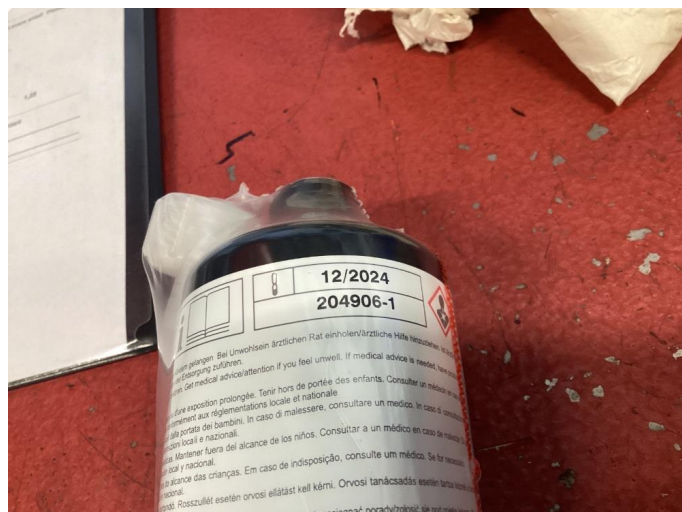
1.2 Dekktemtemiddel utgått/mangler