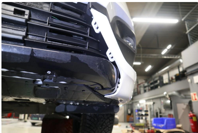
2.1 Noe løst på støtfanger foran