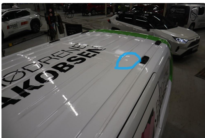
2.2 Liten bulk itak