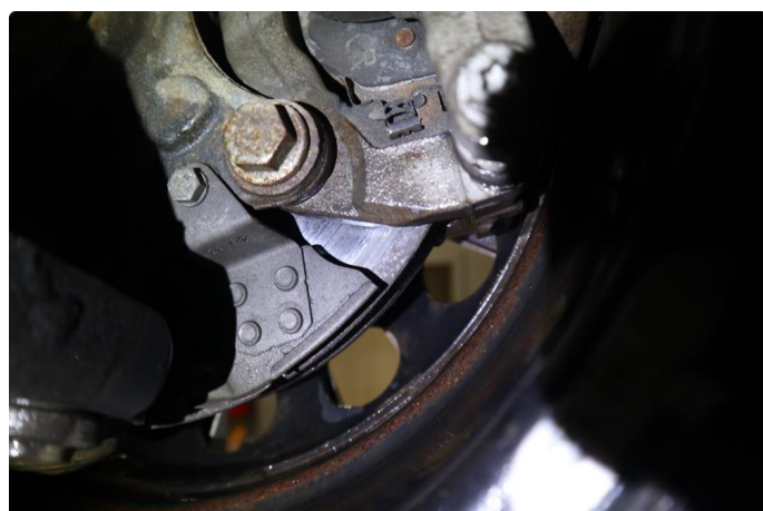
4.1 Rustkant på br.skiver foraln