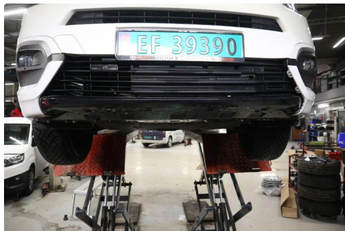
2.1 Noe løst på støtfanger foran