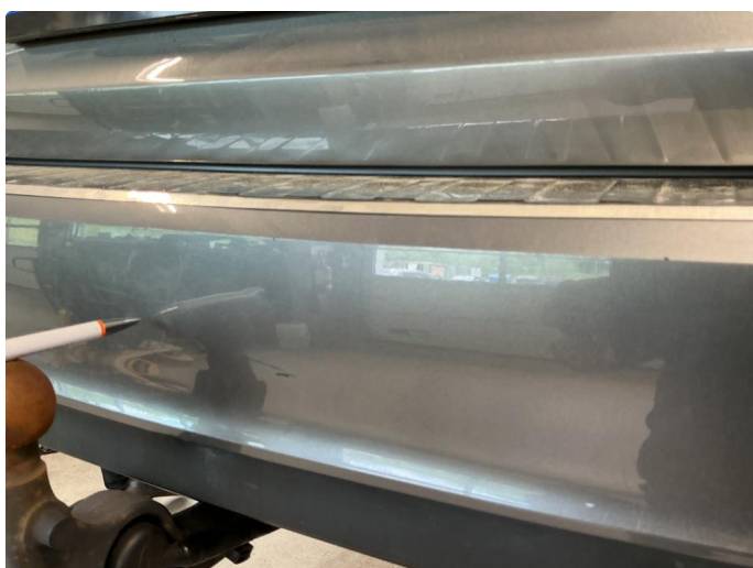
1.5 Noen riper og småbulker