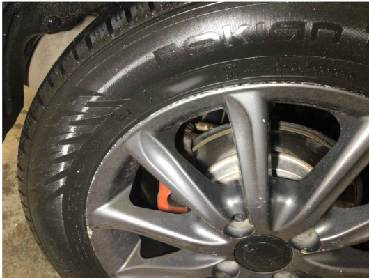
1.2 Kantkjørt to vinterfelger og alle sommerfelger