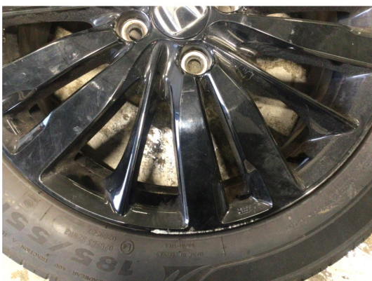
1.2 Kantkjørt to vinterfelger og alle sommerfelger