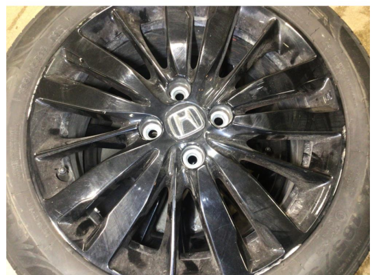
1.2 Kantkjørt to vinterfelger og alle sommerfelger