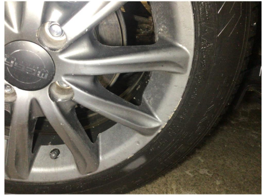
1.2 Kantkjørt to vinterfelger og alle sommerfelger