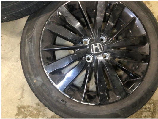
1.2 Kantkjørt to vinterfelger og alle sommerfelger