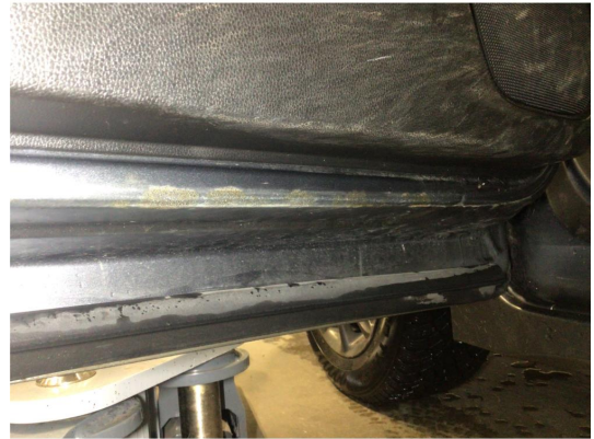
1.1 Noe overfladisk korrosjon på innsiden av dør venstre side framme, dette av minimalt omfang