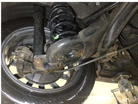
2.1 Overflaterust i bakstilling, ingen tiltak kreves