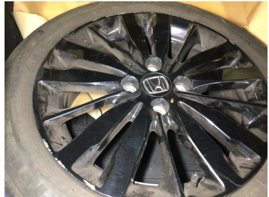
1.2 Kantkjørt to vinterfelger og alle sommerfelger