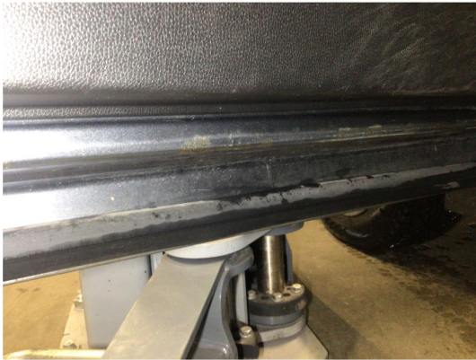
1.1 Noe overfladisk korrosjon på innsiden av dør venstre side framme, dette av minimalt omfang