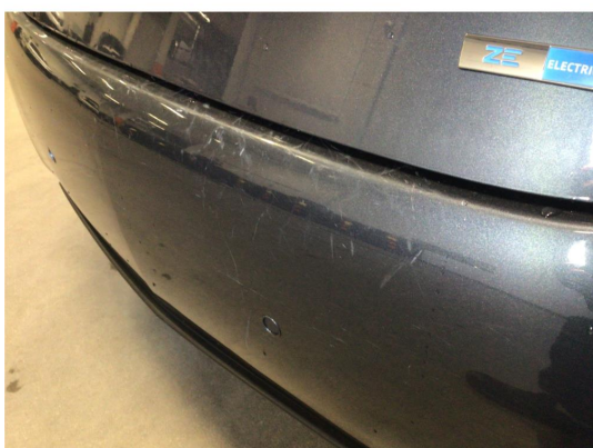
1.2 Overfladiske riper på bakfanger, dette av ubetydelig karakter