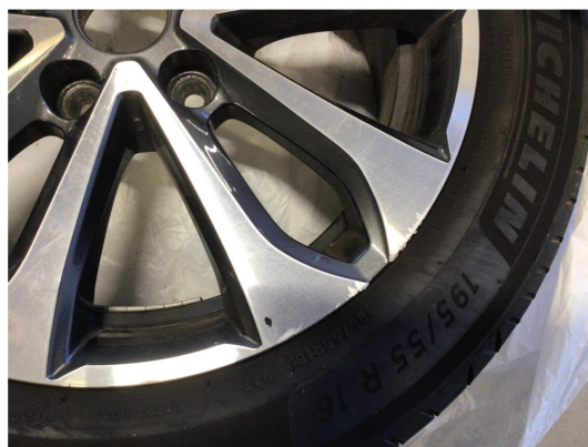
1.1 Kantkjørt en vinterfelg og to sommerfelger