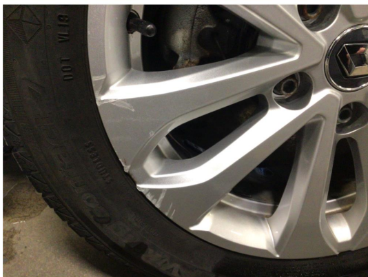
1.1 Kantkjørt en vinterfelg og to sommerfelger