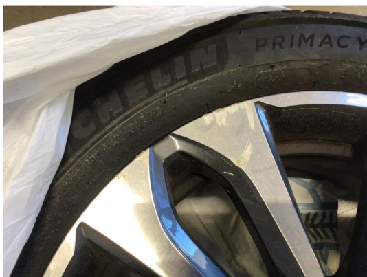
1.1 Kantkjørt en vinterfelg og to sommerfelger