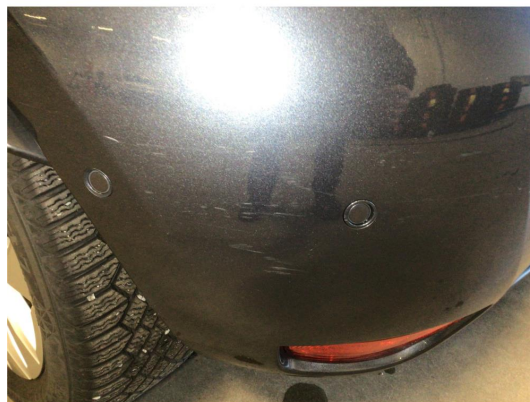
1.2 Overfladiske riper på bakfanger, dette av ubetydelig karakter