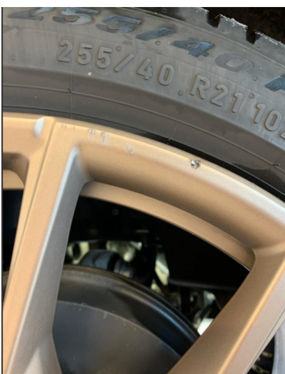
1.2 2 noe kantkjørte sommerfelger.