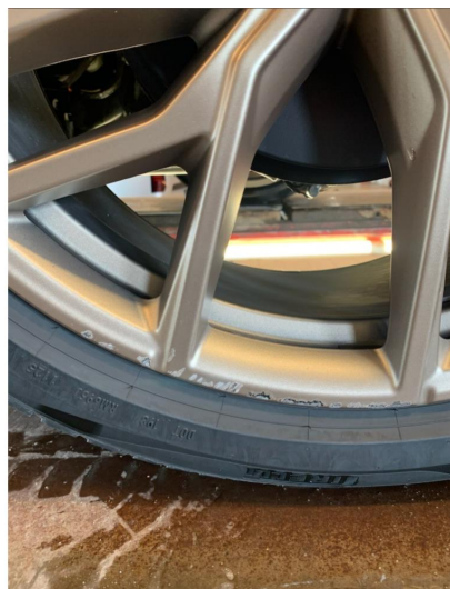
1.2 2 noe kantkjørte sommerfelger.