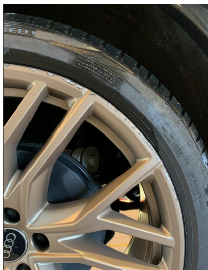
1.2 2 noe kantkjørte sommerfelger.