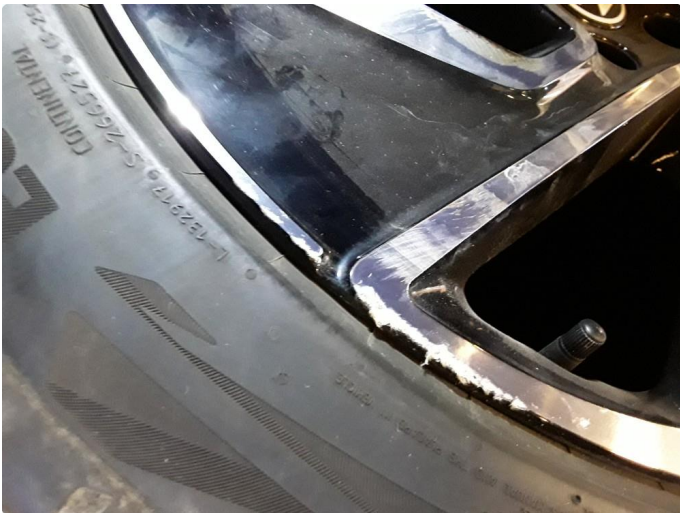
1.2 Noe kantkjørt sommerfelg.