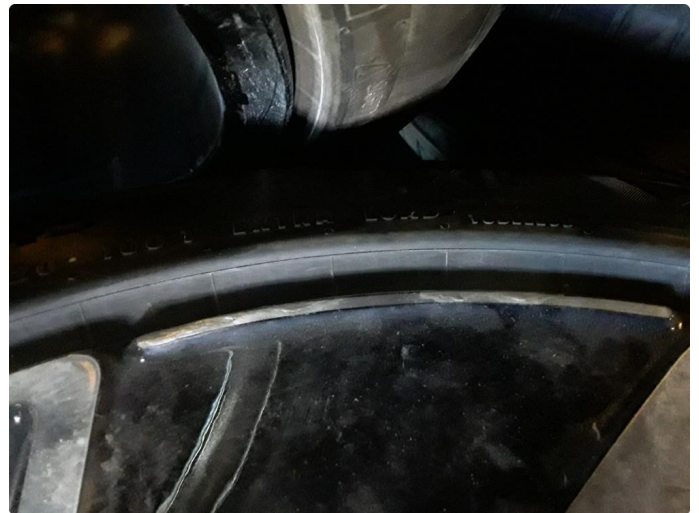
1.2 Noe kantkjørt sommerfelg.