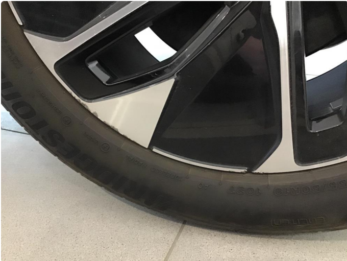
1.1 En sommerfelg litt kantkjørt venstre bak