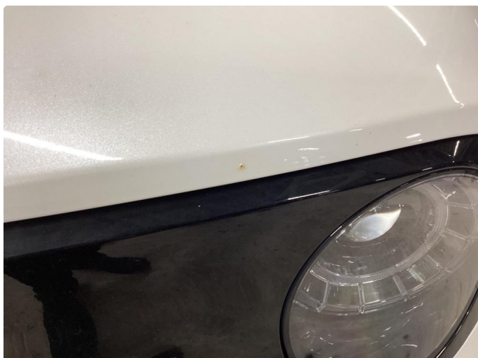
1.1 Liten steinsprut - blir pusset og flikket