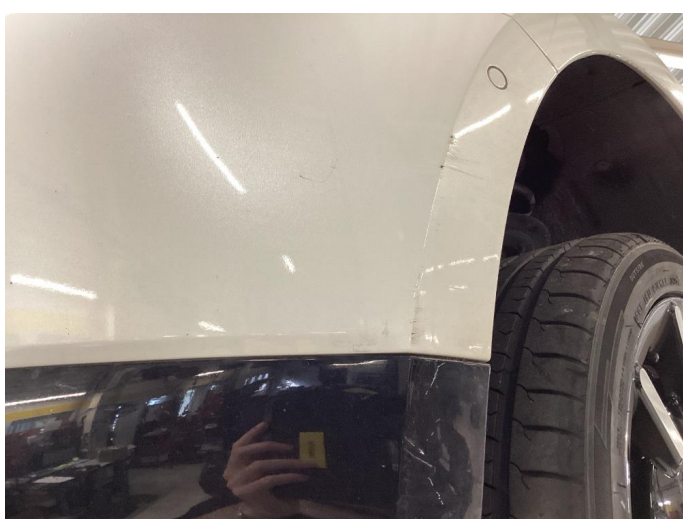
1.5 Småriper i plast, flikket