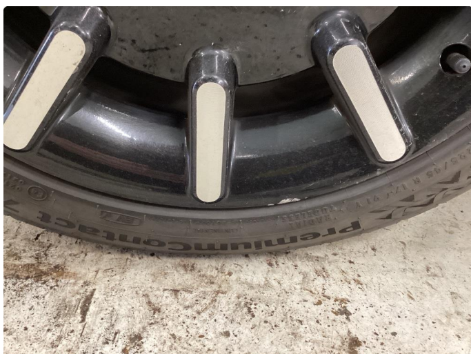
1.3 Lite bruksmerke i kant