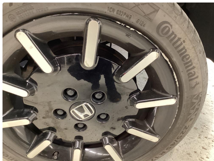
1.2 Noe kantkjørt felg, blir flikket