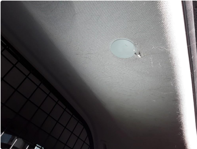
2.1 Noe sår.