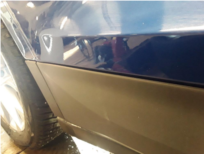
1.2 Liten bulk. Blir forsøkt med bulkfix.