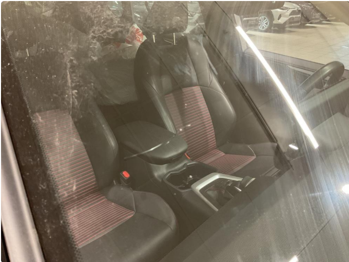
1.1 Steinsprut med sprekk