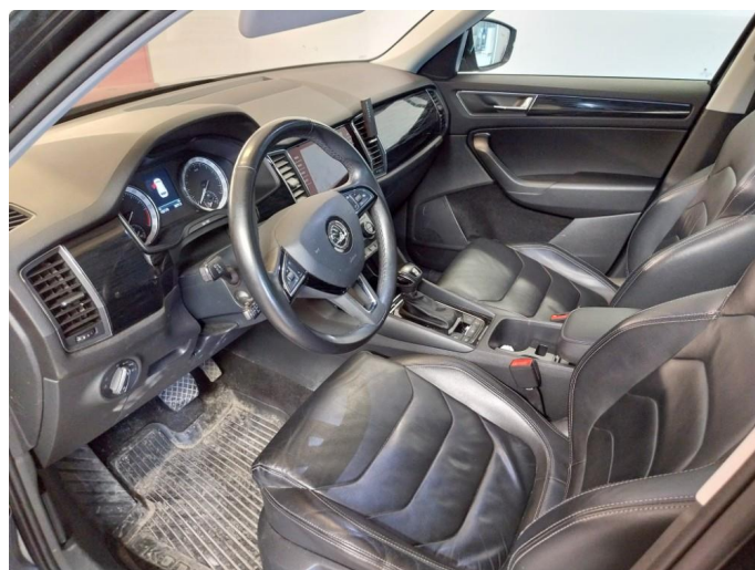
2.1 Div Stensprut og lakkriper finnes.