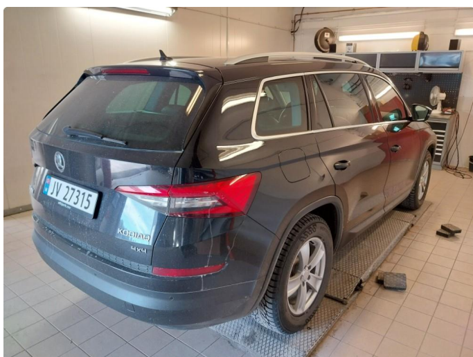
2.1 Div Stensprut og lakkriper finnes.