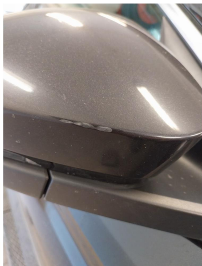
1.1 Speilhus riper