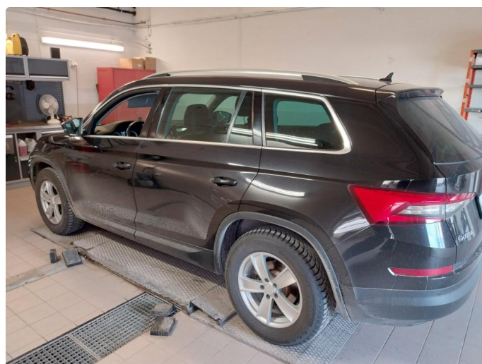
2.1 Div Stensprut og lakkriper finnes.