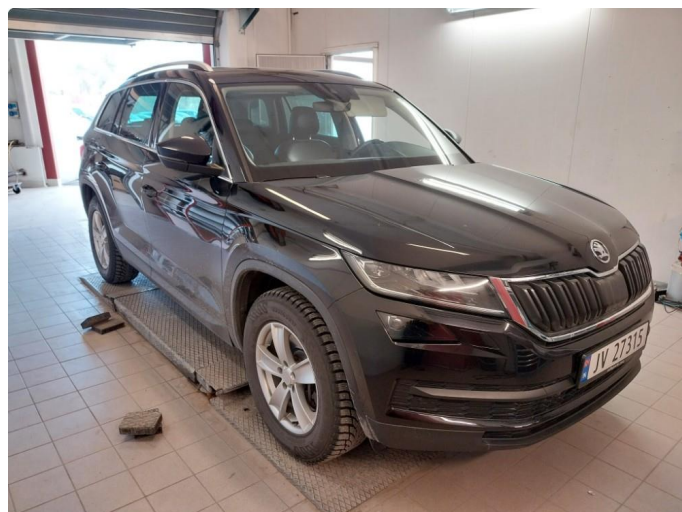
2.1 Div Stensprut og lakkriper finnes.