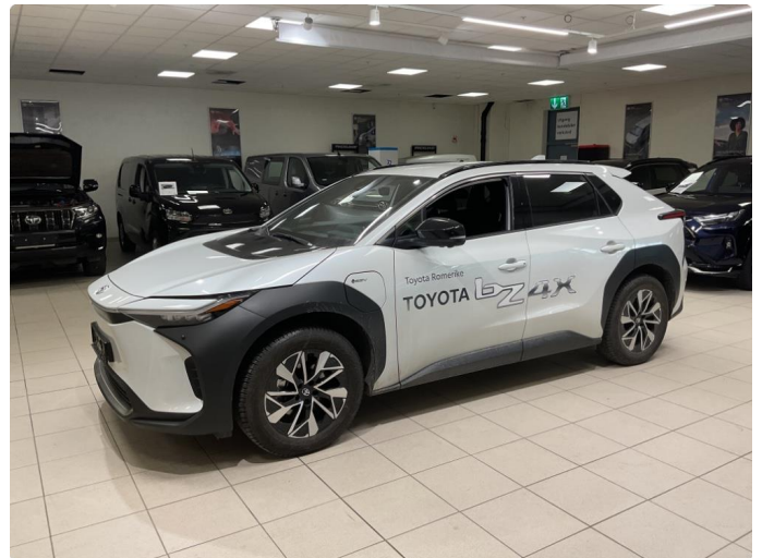
3.1 Fjerne dekor/logo