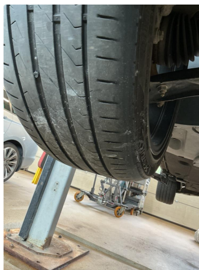
1.6 Skjev slitasje på sommerdekk