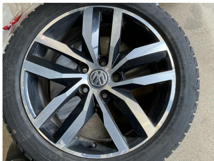
1.4 Betydelig oksidering