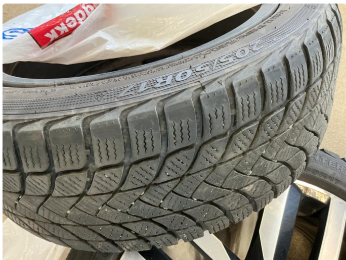
1.7 Skjev slitasje på vinterdekk