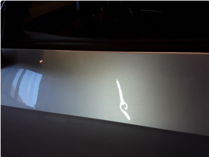
1.2 Liten bulk. Blir forsøkt med bulkfix.