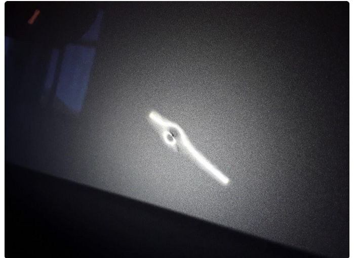
1.2 Liten bulk. Blir forsøkt med bulkfix.